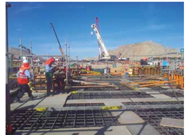
En la imagen: ejemplo de acceso seguro.

Un acceso es toda entrada o paso al interior de un recinto. Puede ser de dos tipos: natural o intencionado. Entre los accesos naturales figuran puertas, ventanas, pasillos, etc. Entre los accesos intencionados cabe citar: terrazas, escaleras de emergencia, canalones, cornisas, etc.