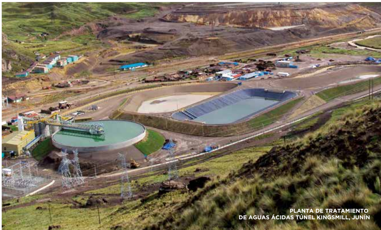
PLANTA DE TRATAMIENTO DE AGUAS ÁCIDAS TÚNEL KINGSMILL, JUNÍN