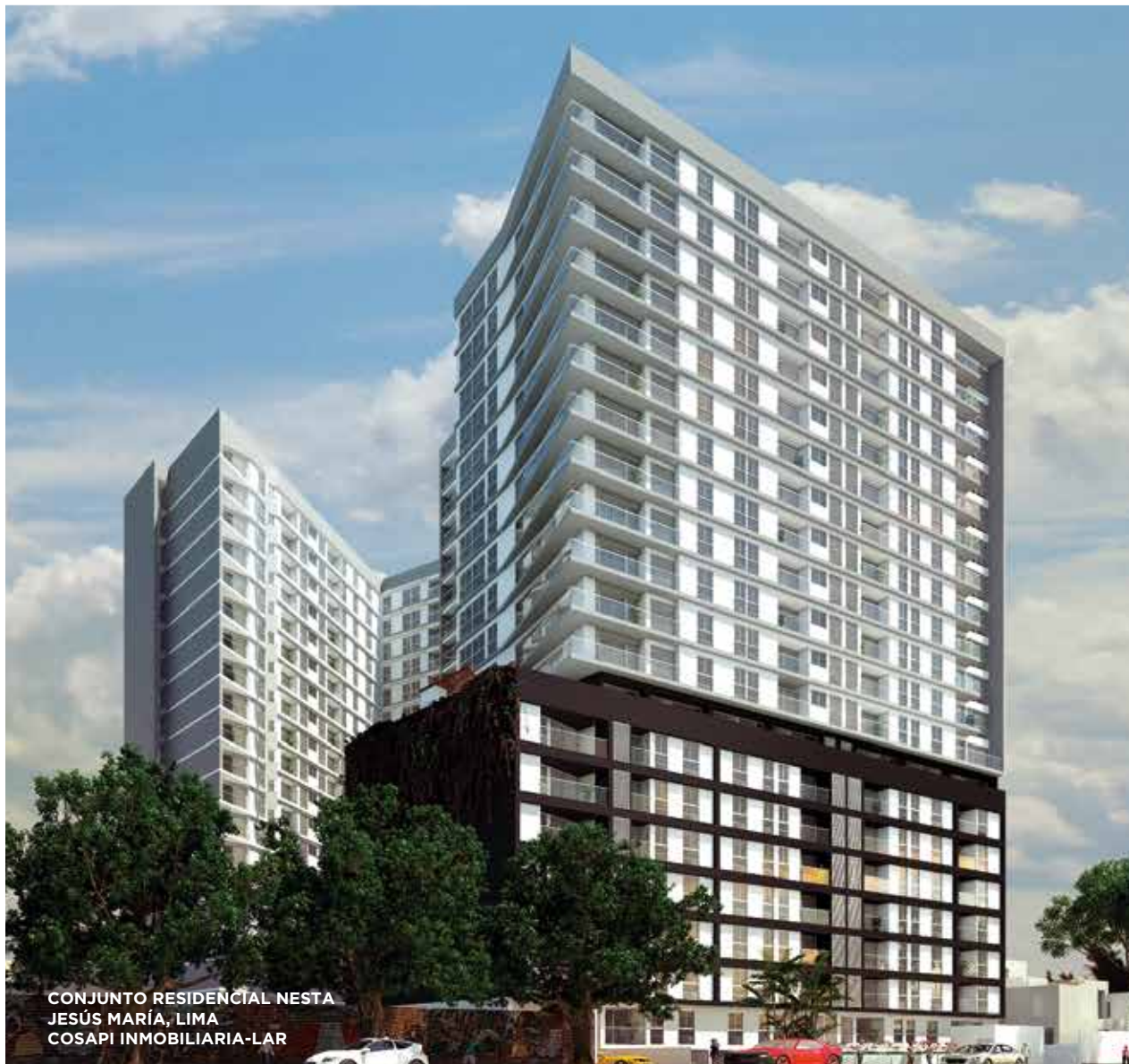
CONJUNTO RESIDENCIAL NESTA JESÚS MARÍA, LIMA COSAPI INMOBILIARIA-LAR