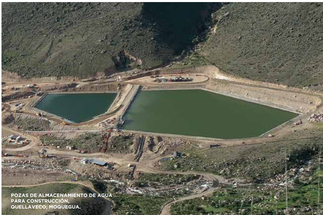
POZAS DE ALMACENAMIENTO DE AGUA PARA CONSTRUCCIÓN, QUELLAVECO, MOQUEGUA.