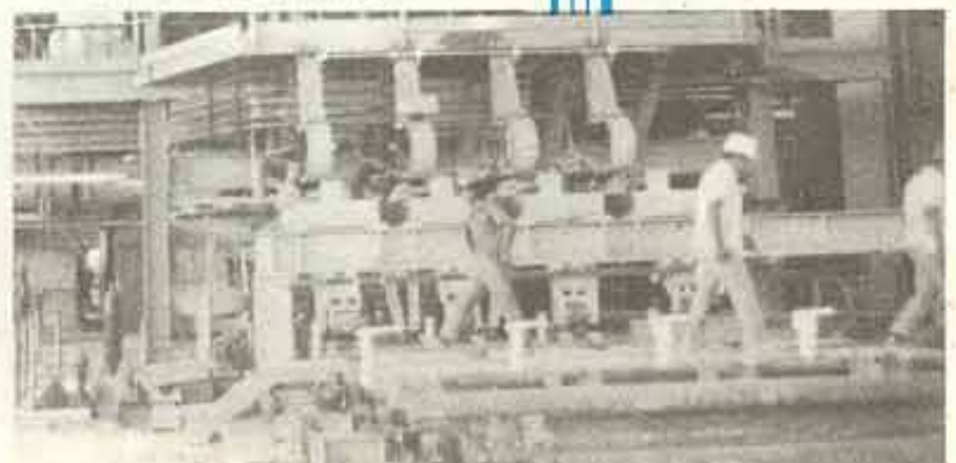
Acería Eléctrica de Sivensa